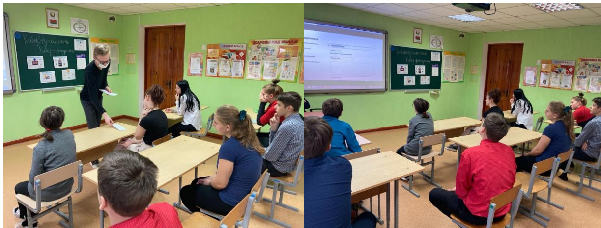
Познавательное мероприятие для 8-11 классов «Кибербезопасность. Киберпреступник» с просмотром видеоролика (Прибыш Н.В.).