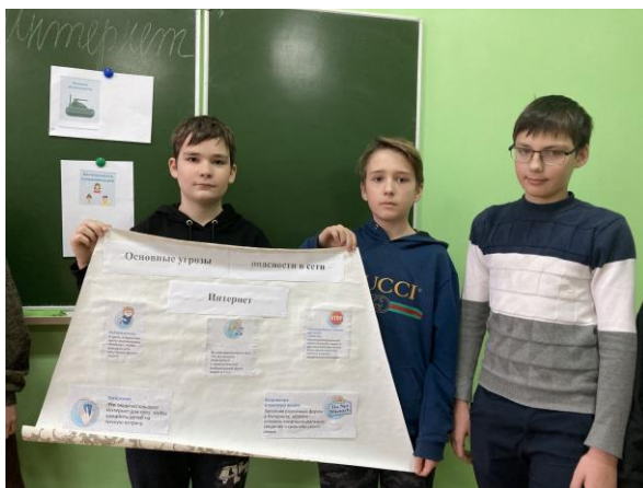
Интеллектуальная викторина «Безопасный Интернет» с оформлением плаката. (Менько Т.Г.)